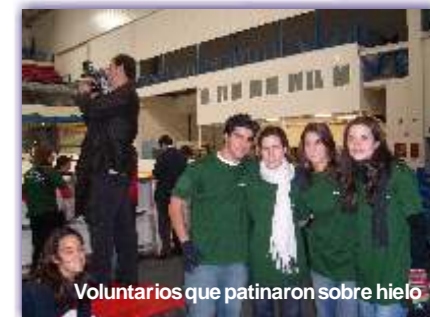
Voluntarios que patinaron sobre hielo