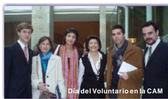
Día del Voluntario en la CAM