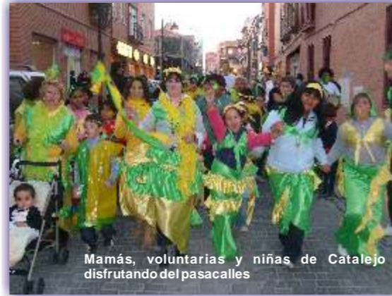
Mamás, voluntarias y niñas de Catalejo disfrutando del pasacalles