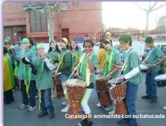
Catalejo II animando con su batucada