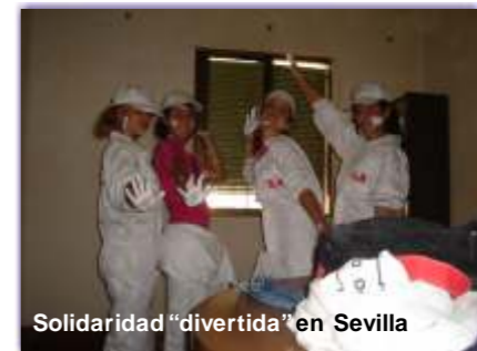
Solidaridad "divertida" en Sevilla